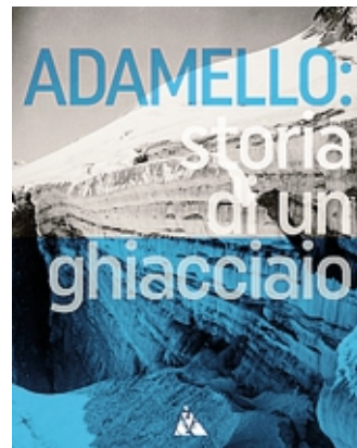
Il volume sull'Adamello