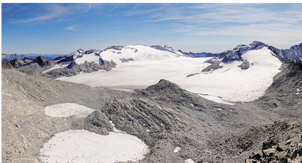
Tre immagini che documentano il ritiro del ghiacciaio, tratte dal libro edito dal Parco dell'Adamello

Studi, libri, articoli, documentari, programmi radio, podcast, social media: di ghiacciai si parla sempre di più e sempre più accuratamente, con un forte sentimento di allarme e di perdita: la perdita di un legame profondo tra noi e i ghiacciai.