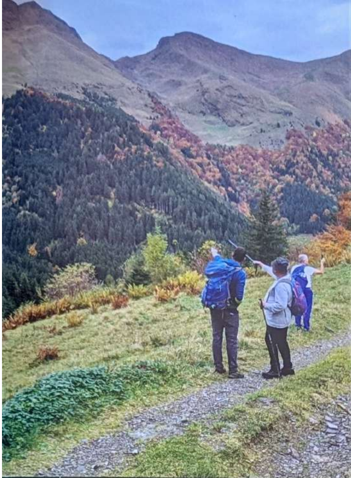
Il posto di Ognidove

non solo di accogliere i clienti per un meritato e legittimo guadagno, ma di conservare il territorio sul quale operano, tramite segnaletica e manutenzione di sentieri ormai persi nella vegetazione, proponendo escursioni organizzate per far rivivere il vero senso dello stare in montagna e proponendo piatti stagionali delle antiche pratiche culinarie locali. Noi, questo modo di vivere e relazionarsi con gli ospiti lo abbiamo trovato altamente geopoetico. Alle ore 14,42, nel preciso istante astronomico in cui la luce solare giunge perpendicolare all'asse terrestre, passando esattamente dai due poli tale da determinare la divisione dell'emisfero, uguale nella parte in luce e nella parte in ombra, in quell'attimo così magico per le popolazioni native di ogni parte del globo, eravamo raggruppati sul prato antistante la Baita Iseo, trasportati, come in estasi, sulle gelide distese sconfinite del Polo Nord, ammalati da quella sottile luce artica che filtra tra la coltre di nebbia, tra i pertugi di nubi basse, per dare speranza al dubbioso viandante e, metaforicamente, a tutti gli esseri viventi.