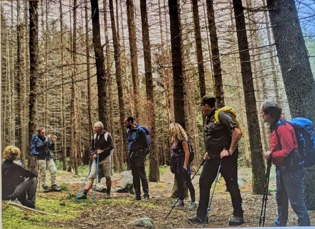
• Nel feudo del bostrico