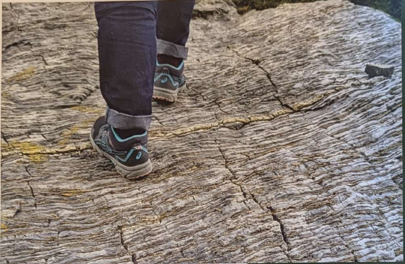
• Camminando sulla storia della Terra