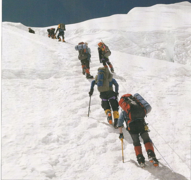
Verso la vetta Gli sherpa di Discovery Channel portavano sul casco una helmet cam per documentare la scalata vista dai loro occhi.

pante (inter)attivo. Una sorta di consacrazione tecnologica, per il "popolo delle grandi vette".