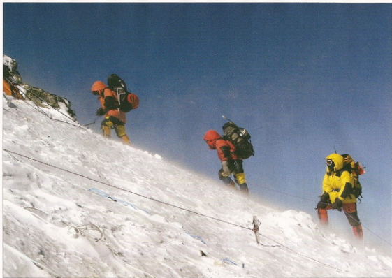
Sempre con la stessa andatura

Tre dei 24 sherpa della spedizione iniziano la scalata dal Campo 2, a 7.470 metri sul livello del mare.