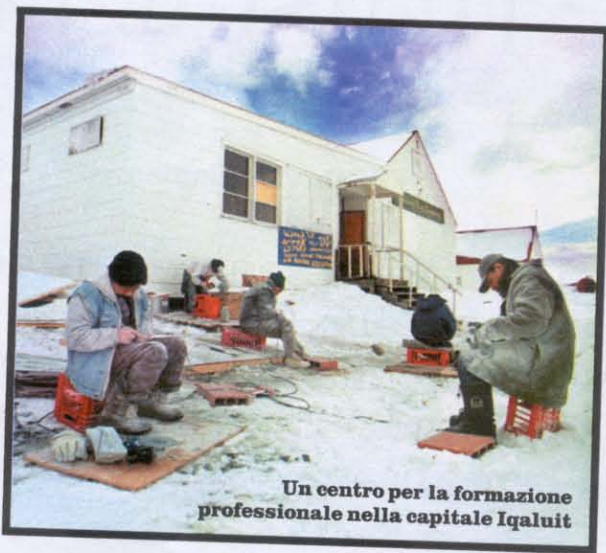
Un centro per la formazione professionale nella capitale Iqaluit

La generazione della Kilabuk è la testimonianza di che cosa accade se si è scaraventati a un tavolo delle trattative provenendo da una sperduta comunità artica: si soccombe, anche quando si ottiene la sovranità sul territorio e un miliardo di euro di «riparazioni». Iqaluit è una cittadina di circa seimila abitanti sulla Baia di Frobisher (significa «il posto del pesce»). Nata nei primi anni Quaranta, continuò a espandersi attorno a un gruppo di accampamenti. Gli Inuit divennero i guardiani dell'Artico, svolgendo un ruolo di sovranità importante per il Canada.