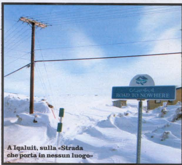
A Iqaluit, sulla «Strada che porta in nessun luogo»

Con questo corredo genetico di adattabilità (ed è stato istruttivo visitare la mostra Inuit e popoli del ghiaccio , allestita a Torino in questi mesi: www.popolidelghiaccio.it ), gli Inuit hanno ribaltato una situazione che nel 1969 parve precipitare con la famosa «Carta Bianca» dell'allora Ministro agli affari indiani Chrétien: egli proponeva l'eliminazione dello status di «aborigeni» per gli Indiani del Canada. L'assemblea delle Prime nazioni reagì con la «Carta Rossa», e attraverso negoziati continui, fece ritirare la «Carta Bianca»: qui iniziò ad apparire un futuro all'orizzonte.